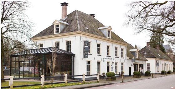
HOTEL & RESTAURANT HET WITTE PAARD

Het voorjaar is ook een periode om -vakantie- plannen te maken. LKGX.nl biedt verschillende mogelijkheden van Hotels, B&B's, groepsaccommodaties, vakantieparken tot campings. Nederland heeft elk jaargetijde volop te bieden.